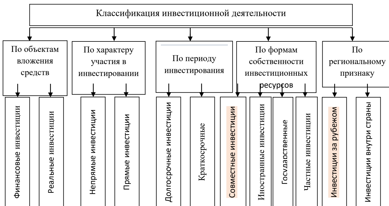
Рисунок 1.- Классификация инвестиционной деятельности [6. С.198]

На основе анализа теоретических исследований и методических подходов как зарубежных, так и отечественных ученых, были выявлены, что научное определение понятия «инвестиции» должно учитывать несколько ключевых аспектов: расходные и резервные направления; использования инвестиционных воздействий и целенаправленное его развитие; эффективное использование инвестиционной деятельности у учётом развития их на ресурсы; количественные показатели и его развития; возникновение риска и неопределенности прогнозирования и в результате достигнуто.